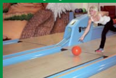
Bowling-Center mit Billard und Tischfußball