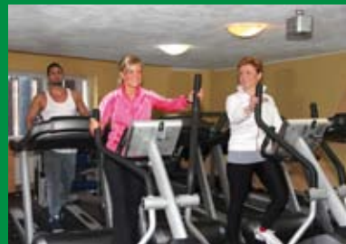
Fitness-Studio mit modernem Gerätepark

Wir laden Sie ein, sportlich und auch vergnügli- lich aktiv zu sein