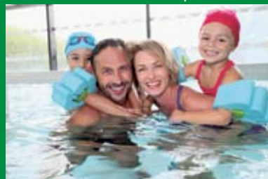
Hallenbad 31° C mit Bewegungsbecken